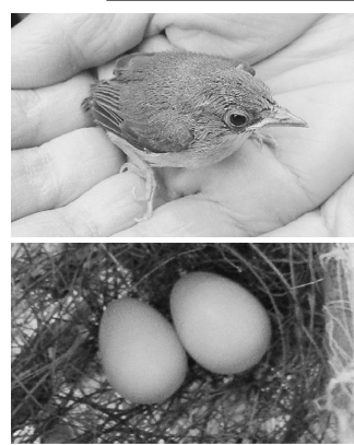
メジロが巣を作ったのは初めてです。メジロはその名の通り目の周りが白い緑色の鳥です。15cmほどの小さい鳥のた

め、カラスや猫などにねらわれやすく、人の通り道に巣を作ることがあるそうです。ちょうど、目の高さほどに巣を作っていたため、毎日職員が観察することが出来ました。卵を毎日1個ずつ4つ産み、温めはじめてから10日くらいで孵化しました。羽毛も生えていなかったので、早いもので、10日ほどで5cmほどの大きさになり、巣立っていました。短い期間でしたが、ヒナ達の成長を見るのは、楽しいものでした。過程の写真は、ほくとホームページの看護部のブログに載っています。