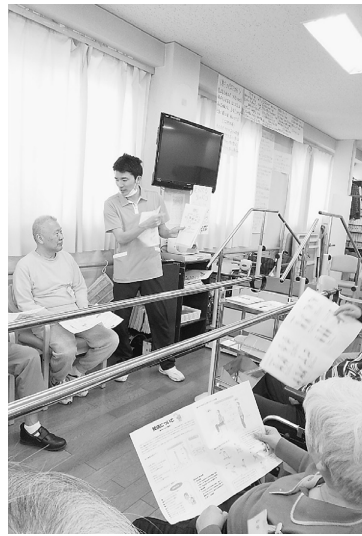
4月は腰痛予防体操

そのための、スタッフは「ご利用者さんたちが混乱してしまうのではないかと」「安全にご利用していただけるのか？」と、不安を抱えての営業開始でしたが、そこはスタッフよりも人生経験豊富なご利用者さんたちです。