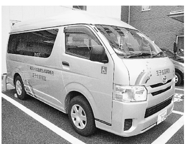
定期的に運行される病院の車

病院にかかっていますが、最近足腰が弱くなって歩くのが大変になってきました。その時、家の近くの地域のセンターに病院の車が定期的に来るのを聞いて、そこに便乗させてもらう事ができ、何とか病院通いが続けられています。本当に助かっています。