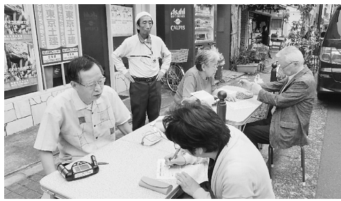
豊島中央通り商店街で健康チェック

5月15日、夕方のお買い物帰りの方、散歩中の方など10人以上の方がチェックをされました。「いつもより少し高いわ、気をつけます」「結果の用紙はお薬手帳に入れておきましょう」「以前もここで測ってもらいました、今回も測っていきましょ」「毎日歩いてはいるけど、運動になってはいるのかしら」など話され、生活習慣を見直すきっかけとなりました。またランニング中のモンゴルから来た若い男性も健康チェックに興味を示していました。