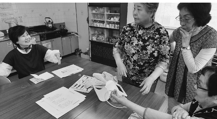
みんなで血圧測定