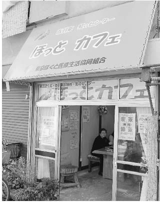
カフェ前にテーブルを置いて健康チェックを行います

5月15日、夕方のお買い物帰りの方、散歩中の方など10人以上の方がチェックをされました。「いつもより少し高いわ、気をつけます」「結果の用紙はお薬手帳に入れておきましょう」「以前もここで測ってもらいました、今回も測っていきましょ」「毎日歩いてはいるけど、運動になってはいるのかしら」など話され、生活習慣を見直すきっかけとなりました。またランニング中のモンゴルから来た若い男性も健康チェックに興味を示していました。