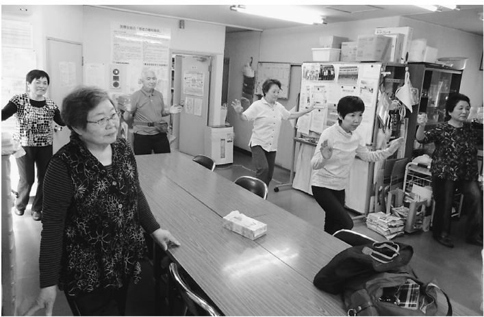
毎週のラジオ体操が班会になりました