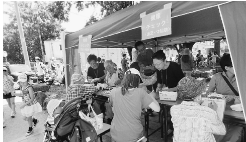
豊島公園カッパまつりで健康チェック

第3水曜日にカフェ前で約1時間、健康チェックを行っています。ほっとカフェに立ち寄った方や商店街を行く方たちが訪れます。赤羽東診療所の看護師が参加してくれるので、医療相