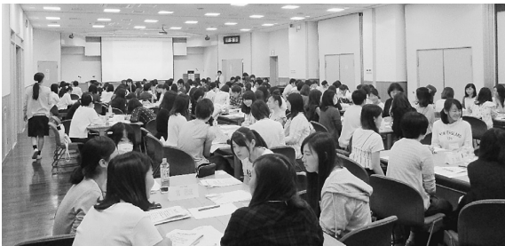
147人が集まりました

講演では、貧困の実態、子どもたちに必要な物、子ども村の活動内容について知ることができました。孤立が様々な貧困をつくり、人間関係が狭い親が子どもを虐待してしまうことがら、貧困と虐待が関連していることが分かりました。大事なことは、子どもたちの居場所であり、地域での関わり合いが求められてい