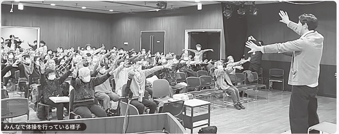
みんなで体操を行っている様子

2月14日、組合員と職員の活動交流集会(以下、交流集会)を、10年ぶりに開催しました。地域組合員と職員が各支部、各事業所でのお互いの活動を知る機会をつくることで、日々の交流につなげることが目的です。