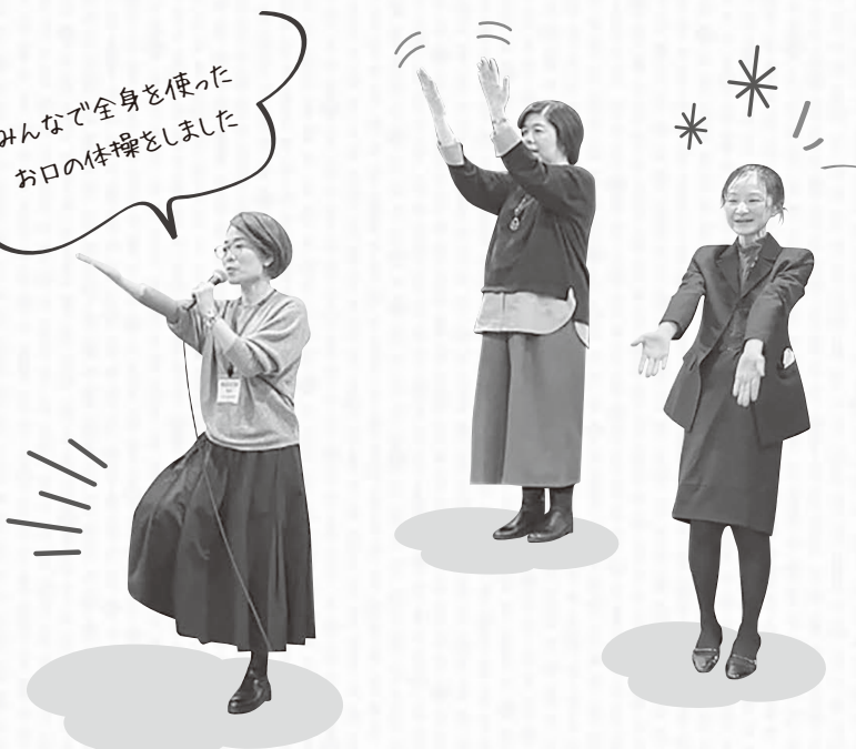
みんなで全身を使ったお口の体操をしました

緩和ケア病棟では、患者さんに寄り添ったケアをしていると思いました。「私らしさを大切にする」という言葉も素敵でした。病棟の様子を伝えてもらえる機会があって嬉しかったです。