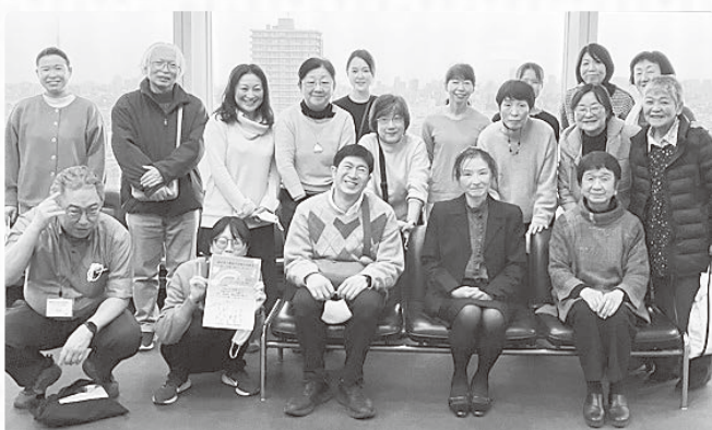
組合員と職員の活動交流集会 実行委員